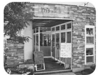
カフェ m's place店舗

幹線道路沿いのお弁当屋さん「m's kitchen」、その工場倉庫街に向かいに立つカフェ「m's place」、工場併設店舗「m's factory」とお菓子工場併設カフェ「STRAWBERRY