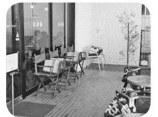
デザートカフェ STRAWBERRY FIELDSの店舗入口